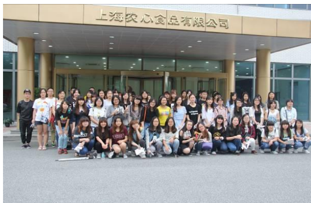
上海农心食品有限公司前合影