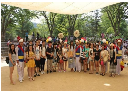
在民俗村同传统舞蹈演员合影