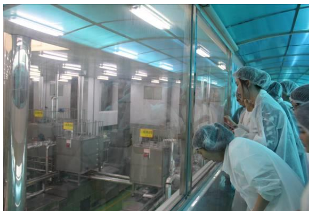
参观上海农心食品有限公司辛拉面生产线