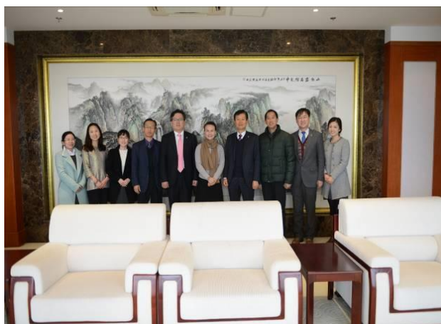
学院领导、韩语系教师与韩亚银行上海分行代表合影