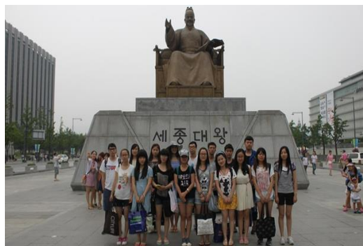
在光化门广场世宗大王像前合影